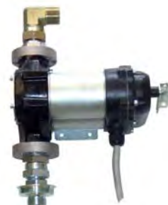
Pumpe „Dieselmatic®“ Master